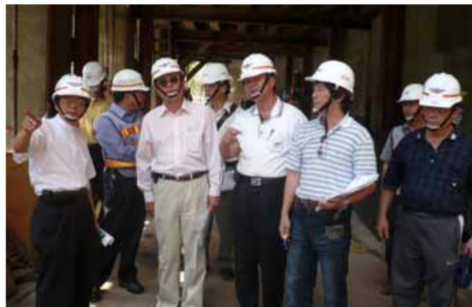
99年7月15日局長視察工程進度

各級長官致詞後在毛部長帶領本局局長、立法委員孔文吉、立法委員楊仁福辦公室主任、行政院東部聯合服務中心執行長高揚昇、花蓮縣長傅崐萁、秀林鄉長許淑銀、銅門村