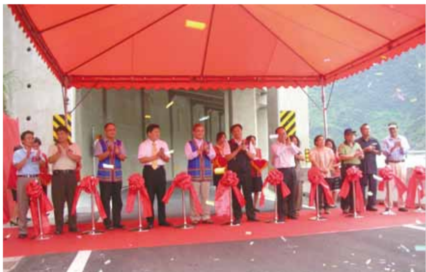
99年8月29日通車典禮部長親自主持