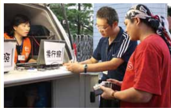
同仁熱情的協助，讓民眾直說「好方便」

將攤位設置好後，瞧見了行動監理車的進駐，馬上到現場辦理換照服務。葉小姐說，監理車在夜市擺攤期間提供服務，「很方便」，空閒時就可以到監理車換照，讓她不必趕著在一般公家機關上下班時間內處理換照手續，省卻麻煩！民眾的反應顯示了此服務的便利及親民。