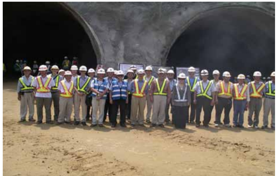
基隆東岸南段工程2號隧道貫通後，在洞口照相留念