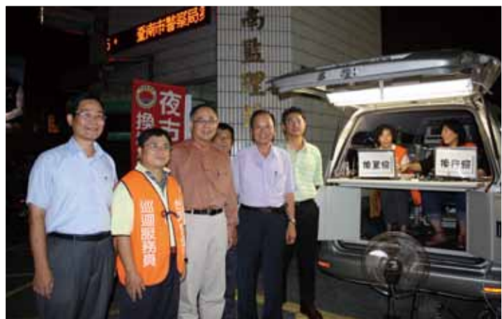
夜市監理站開辦首日，局長特別前往關心同仁工作情況