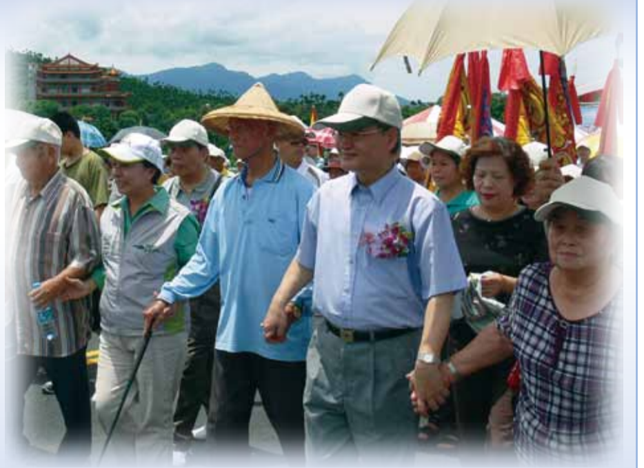
部長牽著耆老的手走過新橋，象徵久久長長

本工程位於阿里山山腳下，施工期間基礎施作時適逢雨季，常因八掌溪遇雨溪水瞬間暴漲，所以P1、P2基礎及橋墩作業更是一大考驗，在98年8月8日莫拉克風災將P1橋墩鋼筋沖毀，使得施工進度延宕，一度陷於困境，該期間在交通部毛部長及局長視察工地實地瞭解工程進度與困境，加上施工團隊的不斷努力，克服萬難，加班趕