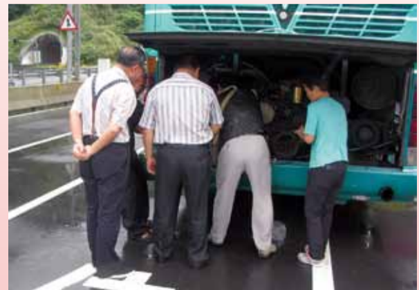
旅客主動趨前幫忙

陸人士16人，來台灣旅遊計有8天行程，今日為第2天行程，預訂由野柳行往宜蘭、花蓮繼續環島旅遊。本所稽查人員實施車輛臨時安全檢查，依聯稽路檢標準作業程序及注意事項向旅客表示聯稽路檢用意，並檢查安全門、滅火器及車窗擊破裝置等相關設施是否符合規定。