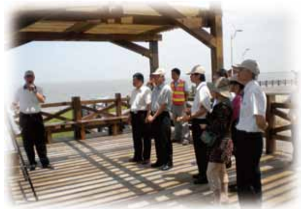
各委員在賞鳥亭聽取毛課長簡報