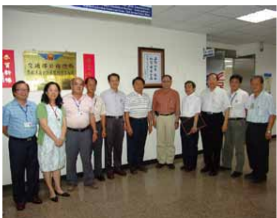
局長與處內同仁在交通部毛部長勉勵西濱南工處同仁「工程如期 施工如質 成本如度」的字帖下合影

局長於99年7月2日下午12點40分視察嘉南地區橋梁整建工程及省道路平專案執行情形與成果。簡報先由楊處長分二部分進行說明，第一部分為目前執行公務預算、新工特別預算、養路特別預算及代辦道路工程等9項建設計畫，總核定計畫經費為270.9億元；其次，就標案執行情形各項工程分別說明。目前綠建築已為世界性的趨勢，因此第二部分簡報即針對本處提出的SCLC(自充填輕質粒料混凝土)研究案充分說明，SCLC係將現今已經相當成熟的SCC(自充填混凝土)技術，利用水庫淤泥燒結成的輕質粒料予以結合，預估其成效將可提高構造物施工度、降低結構體自重並減輕地震力影響、縮小結構斷面增加橋梁跨度或梁下淨空等多重效益，其結果亦符合行政院吳院長所提示水庫淤泥變建材的政策。簡報結束後隨即由五工處蔡副處長及新營段黃段長簡報嘉南地區路平專案執行情形及成果。