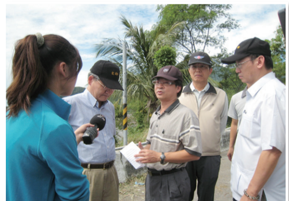
王段長口頭向部長報告最新的受災情況及展開中之搶修事宜

這次88颱風災情的慘重，災民臉上驚恐的表情及淒瀟的哀嚎聲，深深烙印在國人心中，我們是否深刻領略到大自然不可抗拒的力量了？台灣氣候宜人，卻有三分之二都是高山丘陵地，是個美麗又脆弱的小島，這片