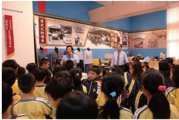
祥和國小師生家長參訪1樓歷史文物檔案展示區情形

展示活動於本所服務一樓大廳與三樓走道迴廊建置歷史文物檔案展示區、檔案應用閱覽區、監理尋根暨檔案應用入口藝象文化走廊及歷年公路監理簡政便民服務績效展示看板等，讓人有如走入時光隧道，懷舊往日時光，發思古幽情而溫故知新。此外，嘉義所自行編纂「尋根之旅」透過系統化整理編纂，提供同仁可以完整回顧本所歷史，亦讓新進同仁能緬懷先進筚路藍縷與豐功偉業之足跡；「公路監理歷史文物