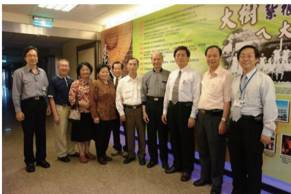
趙副局長及退休同仁參訪本所3樓入口藝象