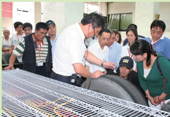
檢測輪胎磨損程度

隨著科技發展與生活品質之提升，職業駕駛工作品質與專業知識需求亦與日俱進，許多職業駕駛人都苦無充電學習、自我精進的機會，此次交通部透過修訂汽車運輸業管理規則，建立職業駕駛回訓制度，讓