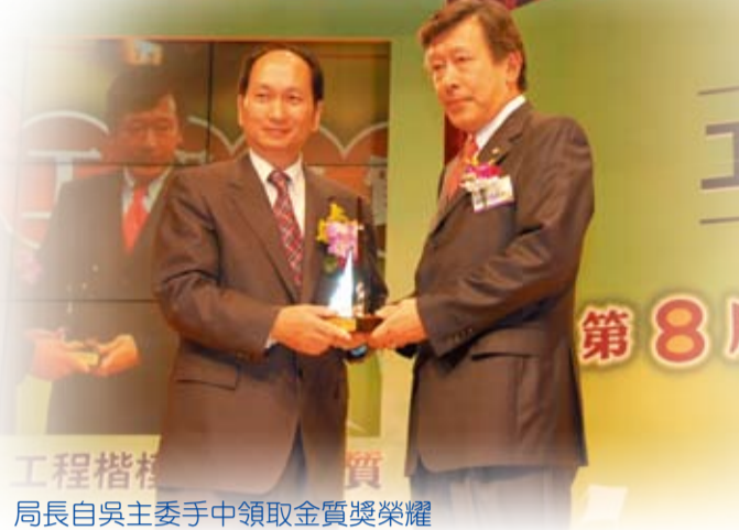
局長自吳主委手中領取金質獎榮耀