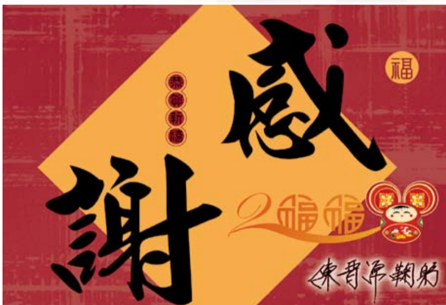
歲末年終之際局長感謝全體同仁辛勞並祝福大家平安喜樂