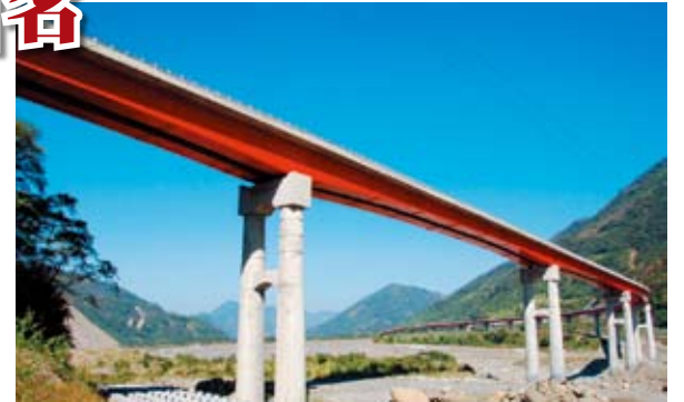
跨越陳有蘭溪橋完工現況