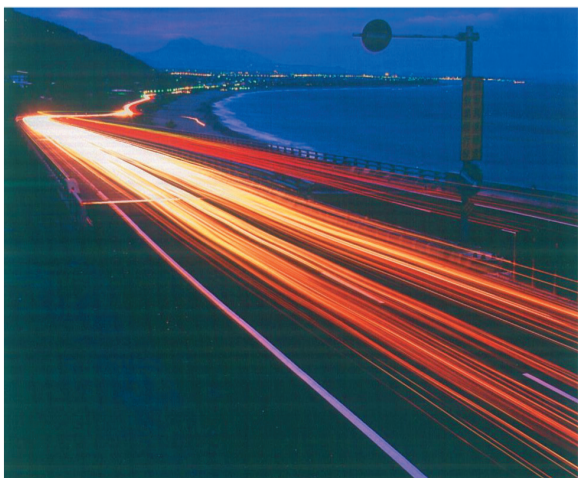
▲台9線附近太麻里，是千禧年與全球同步衛星連線躍2000年迎接第一道曙光的地方