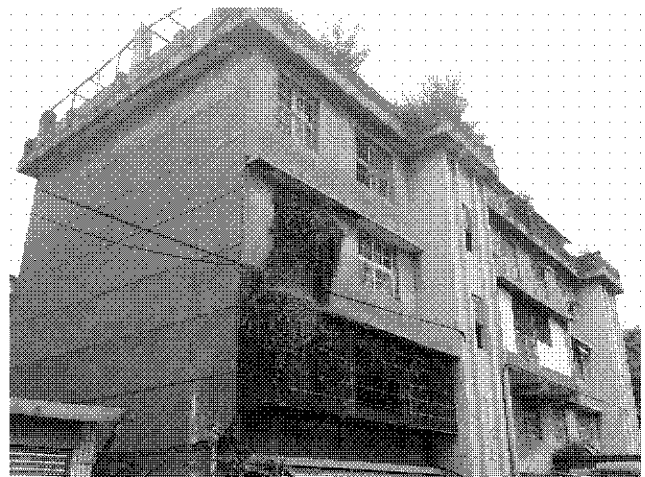
文山區興德路 47 巷 8 號-12 號