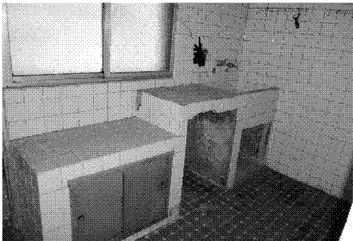
遼寧街 74 號 1 至 4 樓